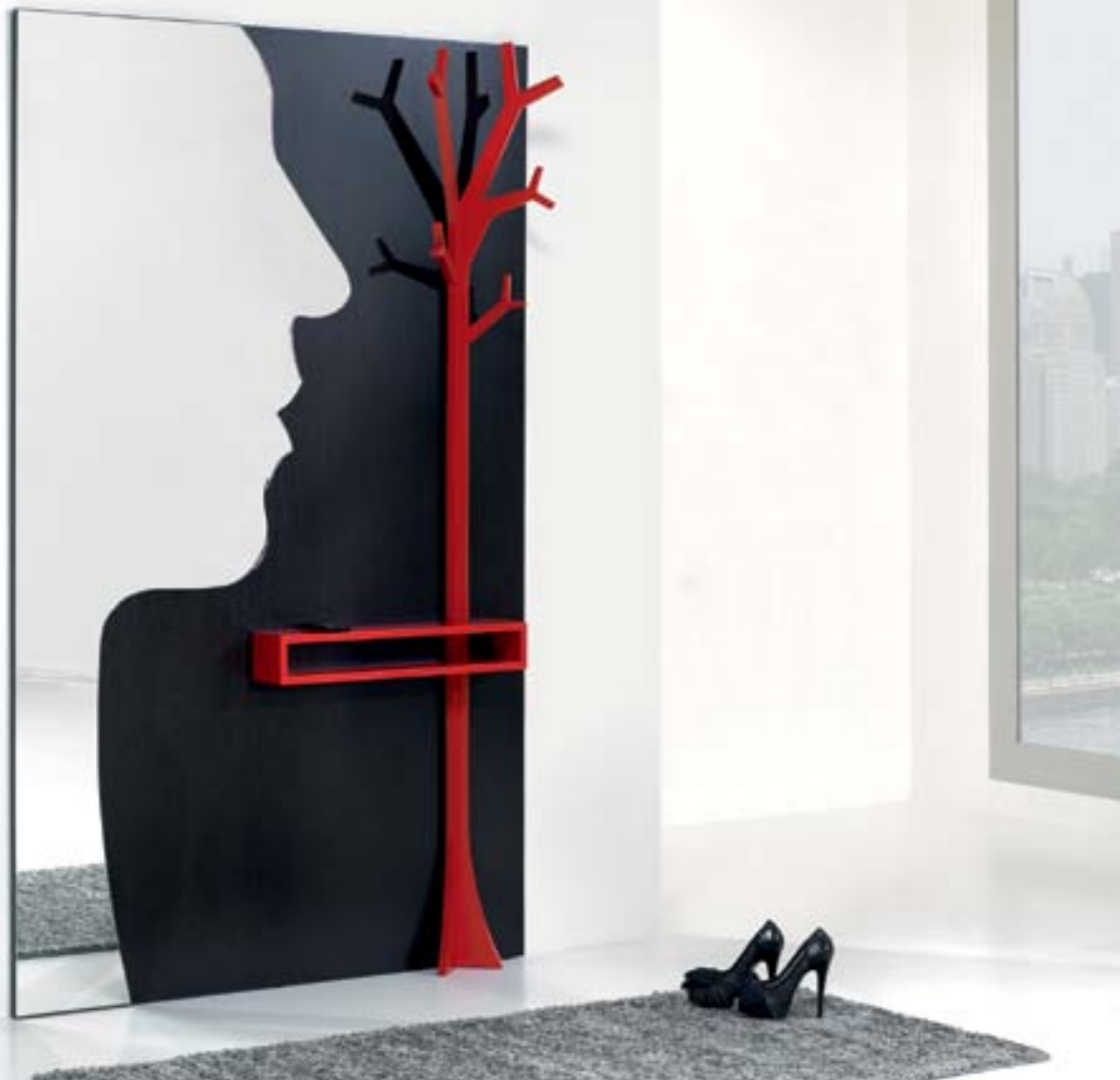
HALL DE ENTRADA VINTAGE C 1200 L 180 A 2000 795€