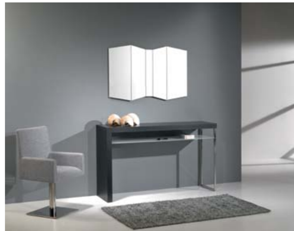
CONSOLA COM MÓDULO DE GAVETA COM FRENTE GAVETA EM NOGUEIRA C 1600 L 350 A 870 899€