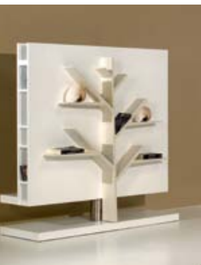
PAINEL PLASMA GIRATÓRIO 360º DUPLA FACE C/ PRATELEIRA P/ CD'S/DVD'S C 1450 L 520 A 1500 1546€