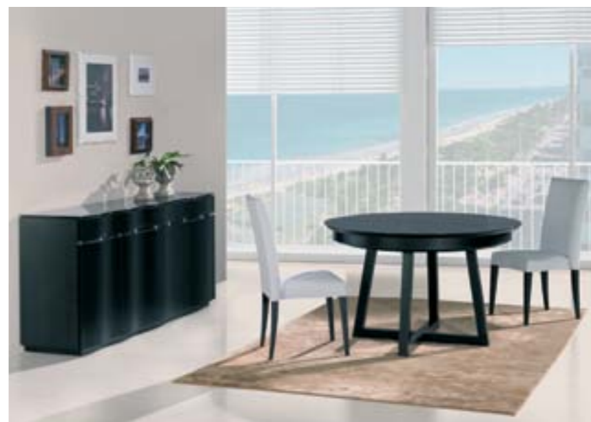
CADEIRA TODA ESTOFADA (EMPILHÁVEL) C 465 L 485 A 1020 DESDE 155€ TECIDO 250€ PELE